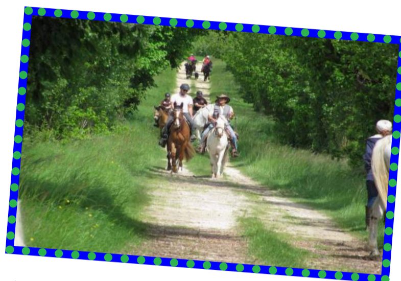
Les 7 è chevauchées 2015