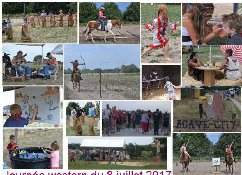
Journée western du 8 juillet 2017

Nouveauté en 2018 : l'ACAVE souhaite organiser un « Trucs and Trocs » le dimanche de pentecôte ; une journée sans échanges financiers, basée exclusivement sur le partage et le développement durable. Nous avons besoin de tous pour la faire vivre !