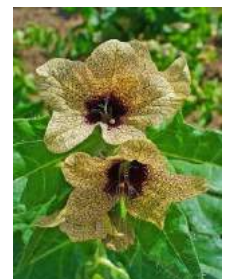
La Jusquiame Noire