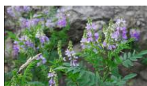
La rue de chèvre