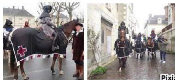
Retraçant l'arrivée de Jeanne d'Arc à Chinon