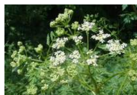
Cigüe (carotte sauvage)