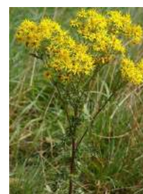
Seneçon de Jacob