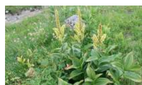
Le Vêrâtre Blanc